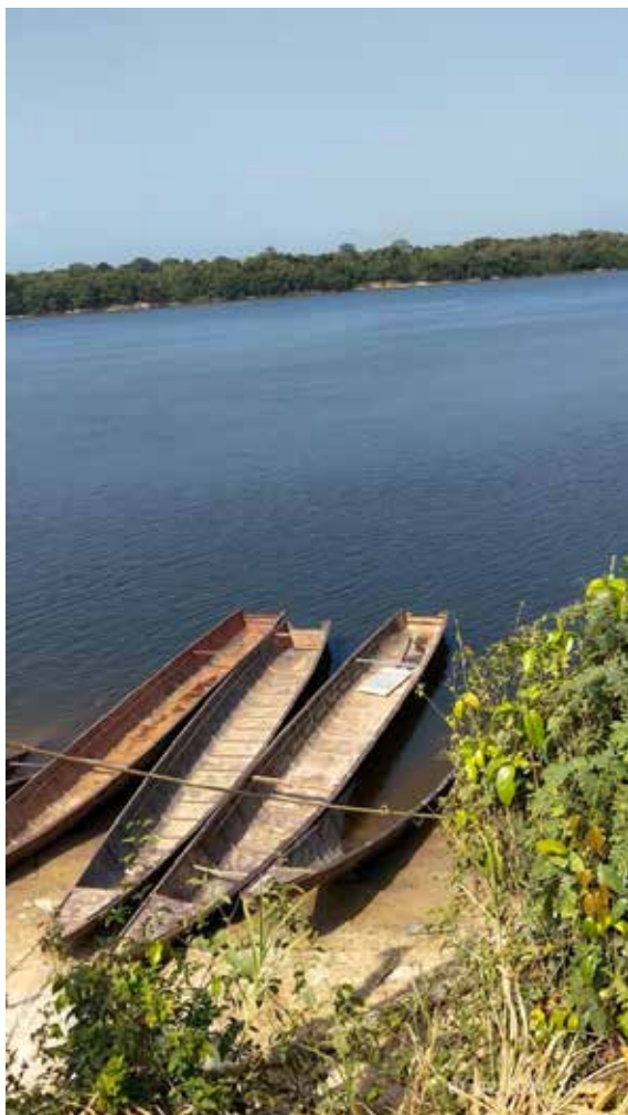
El río Caura.

El Convenio sobre pueblos indígenas y tribales (o Convenio 169) de la OIT 90 describe los derechos de los pueblos indígenas y tribales dentro de los Estados y establece las responsabilidades de los gobiernos de proteger estos derechos. Este instrumento internacional incluye la obligación de los Estados de salvaguardar las personas, las instituciones, los bienes, el trabajo, las culturas y el medio ambiente de los pueblos indígenas (Art. 4.1) la obligación de que los proyectos que se realicen en sus territorios prioricen el mejoramiento de las condiciones de vida, salud y educación de los pueblos (Art. 7.2) y de tomar medidas para preservar el medio ambiente de los territorios que habitan esos pueblos.