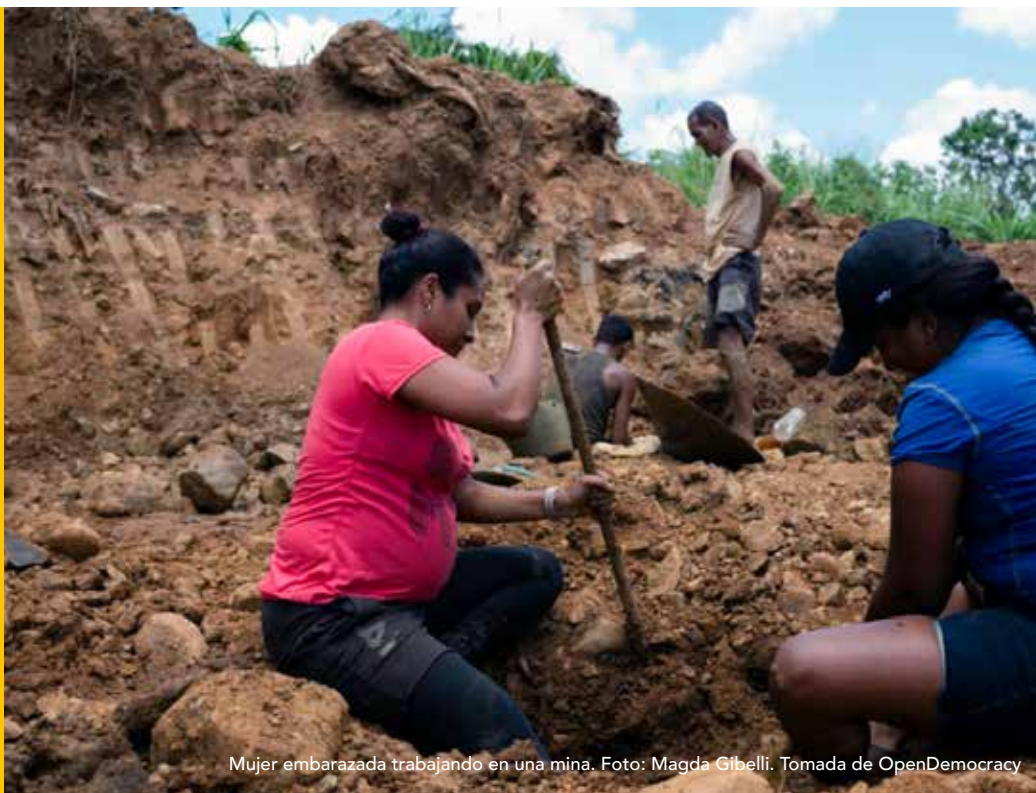
Mujer embarazada trabajando en una mina.