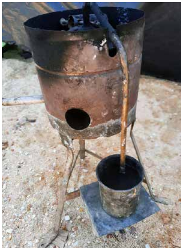
Retorta minera artesanal usada por mineros en Venezuela.

Con respecto a si existe información accesible en Venezuela sobre la utilización del mercurio, el 82,8% consideró que no existe, el 6,9% que existe poca y el 3,4% que si existe.