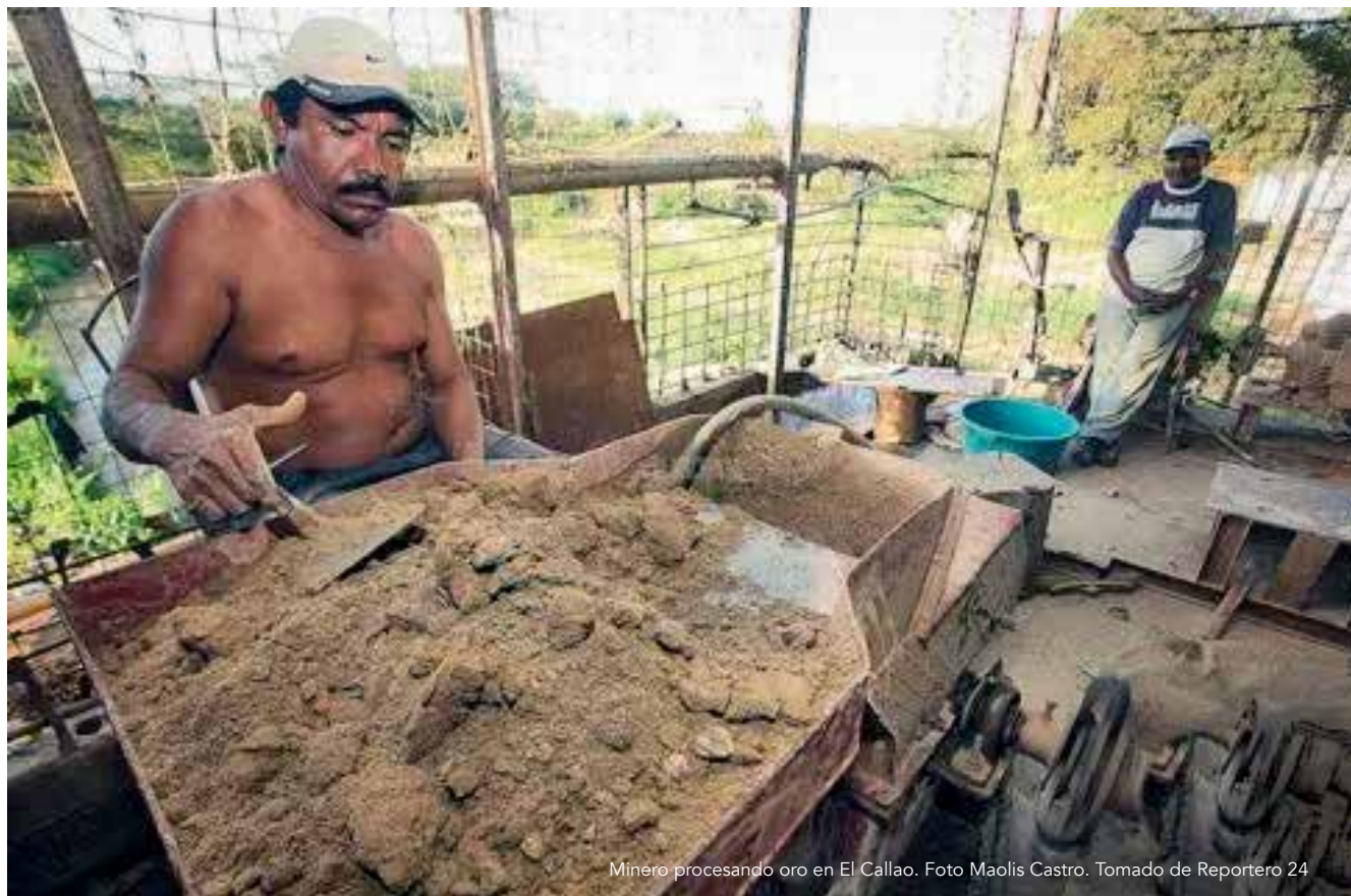
Minero procesando oro en El Callao.

En el caso específico venezolano, muchos de los trabajadores que laboran en la explotación de oro ilegal al sur del país, lo hacen en condiciones que han sido descritas como esclavitud moderna, realizadas en contextos de violencia y en condiciones de trabajo infames 105 106 107 .