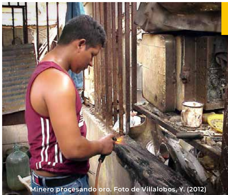
Mínero procesando oro.

En este sentido, el informe del Relator Especial sobre las implicaciones para los derechos humanos de la gestión y eliminación ambientalmente racionales de las sustancias y los desechos peligrosos del 2022 considera que “los abusos y violaciones de los derechos