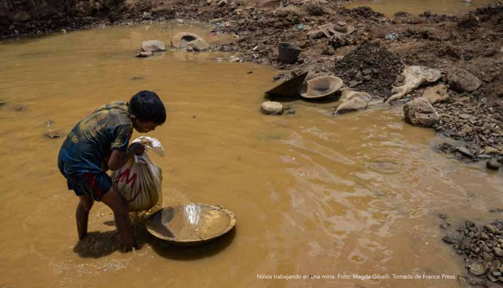
Niños trabajando en una mina.