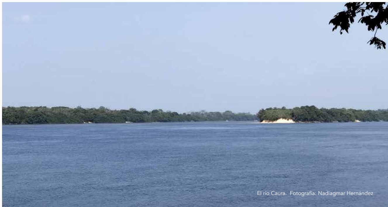
El río Caura.

Esta ausencia de información es común en Venezuela. En el informe de la Alta Comisionada sobre los Derechos de las Naciones Unidas del 2020 sobre Venezuela se afirma que: