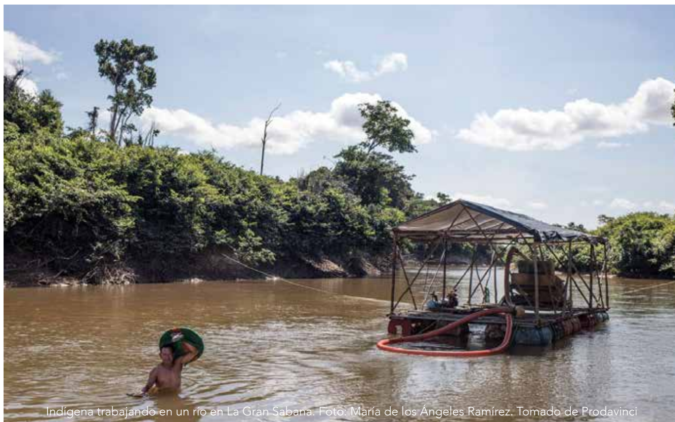
Indígena trabajando en un río en La Gran Sabana.

En este contexto, han sufrido de un grave incremento de la violencia, tanto en su forma tradicional de asesinatos, hostigamiento, estigmatización, esclavitud moderna, trata de personas, así como de violencia ambiental a través de la devastación y la contaminación de sus territorios, esta última por distintas sustancias, pero particularmente por el uso del mercurio en la explotación de oro 77 78 79 80 .