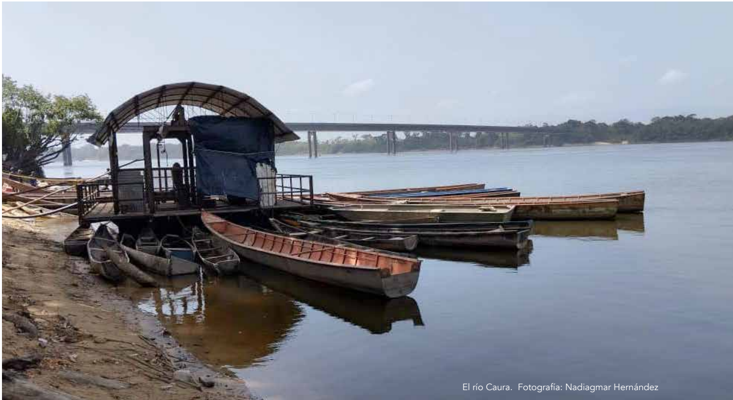
El río Caura.

realización de estudios en las zonas mineras al sur del país.