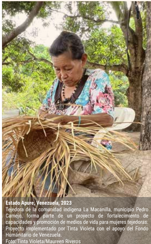
Estado Apure, Venezuela, 2023

Garantizar una respuesta humanitaria inclusiva y de calidad supone la incorporación de áreas transversales que son la responsabilidad del Equipo Humanitario de País y todas las organizaciones humanitarias . Se fortalecerá la articulación y sinergia entre las siguientes prioridades de trabajo: