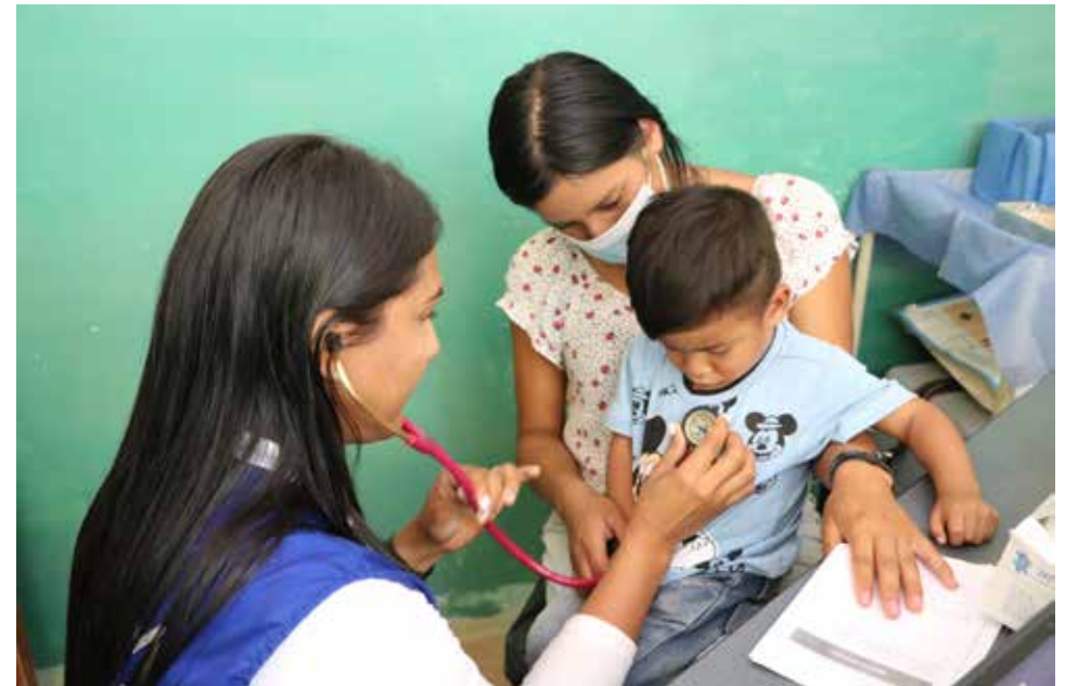
Estado Bolívar, Venezuela, octubre 2023

El marco lógico del Clúster de Salud integrará un enfoque de género y armonizará sus acciones con las prioridades estratégicas de los demás sectores.