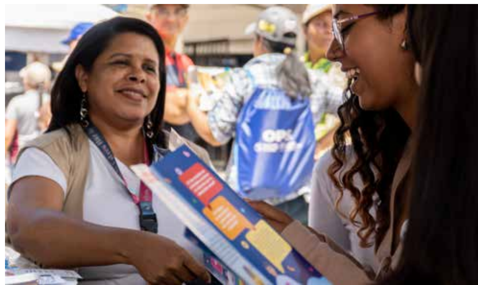
Estado Miranda, Venezuela, agosto 2023 Actividad pedagógica con jóvenes de la comunidad de Petare, municipio Sucre, en el marco de la celebración del Día Mundial de la Asistencia Humanitaria.

Finalmente, se apoyará y promoverá el fortalecimiento de capacidades institucionales y comunitarias para la gestión integral del riesgo y la preparación y respuesta ante desastres.