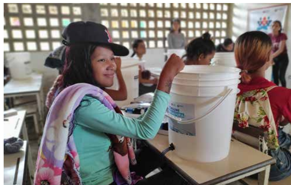
Estado Sucre, Venezuela, junio 2023

A nivel programático, se pondrá especial énfasis en la reinserción escolar, recuperación de aprendizajes, aprendizaje socioemocional y acceso a educación y medios de vida con adolescentes.