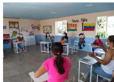
Kinyivi Tere DDHH

https://www.humanitarianresponse.info/operations/venezuela/violencia-basada-en-g%C3%A9nero